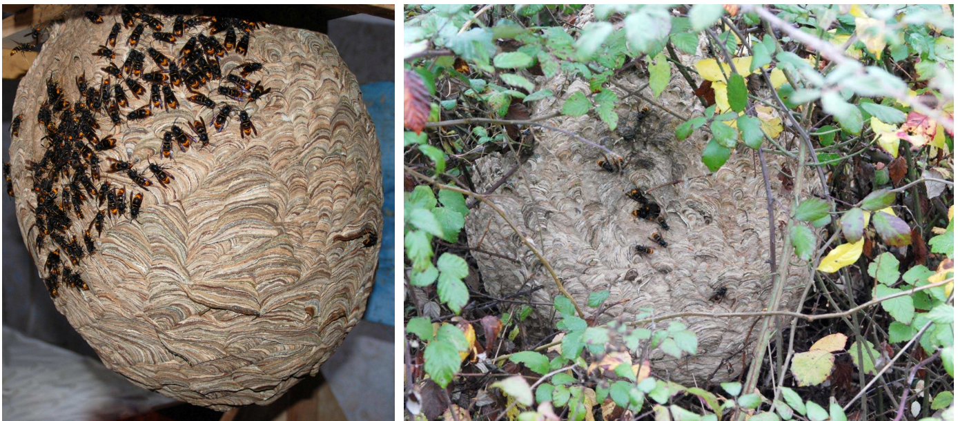
Fig. 1 et 2. – Nids matures de Vespa velutina. – 1, Nid dans un bâtiment chez C. Ceyral à Sergeac (Dordogne) : les mâles nouvellement émergés sont rassemblés autour de l'entrée du nid (17.XI.2008). – 2, Nid au sol dans un roncier à Sainte-Marie-de-Chignac (19.XI.2008).

Vespa mandarinia Smith, 1852, a, par ailleurs, été signalé en France à plusieurs reprises ces dernières années, dans le Var en particulier. Ces affirmations se sont avérées fausses, l'espèce étant confondue avec la femelle de Megascolia maculata flavifrons Fabricius, 1775.